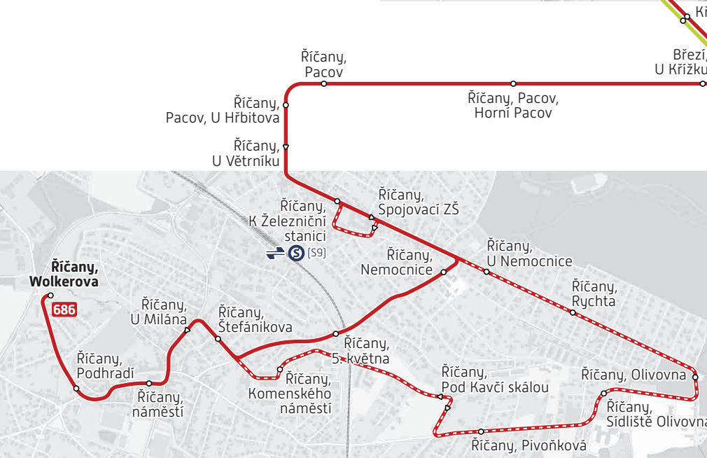
ŘÍČANY – výřez