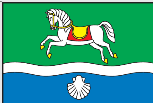
Figura běžícího osedlaného koně je odvozená a heraldicky stylizovaná podle historické pečeti obce z roku 1801 který taktéž symbolizuje zemědělství a charakter. Dále pak vlnité břevno symbolizující místní tok Výmola s místními rybníky a jednak mořskou hladinu odkazující na jednu z legend o sv. Jakobovi, patronovi kostela ve Slušticích. Nakonec je zde Svatojacobská mušle jakožto atribut sv. Jakuba patrona kostela ve Slušticích.